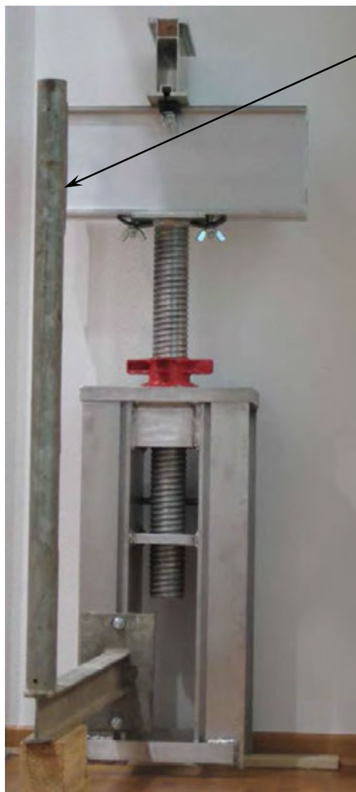
WK 1000 ze wspornikowym słupkiem barierek